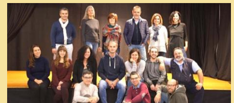
Lunaensemble (Sarzana, Italia)