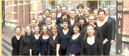
Warsaw Stage Society Choir (Varsavia, Polonia)