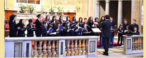
Coro Giovanile della Scuola Comunale di Musica (Mondovì, Italia)

L'interculturalità e il dialogo interreligioso sono alla base di ogni possibile incontro fra le diverse culture, tutte ugualmente importanti e degne di essere conosciute e valorizzate.