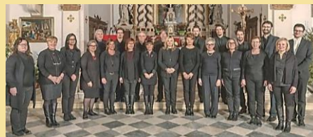
Accademia Corale Musica Reservata (Marostica, Italia)

La partecipazione al Concorso Internazionale corale di Musica Sacra dei cori provenienti da varie nazioni del mondo crea un ambiente importantissimo per tale incontro – stimola la conoscenza approfondita ed il rispetto reciproco, lo scambio dell'esperienze culturali, favorisce la consapevolezza del valore della vita, del dialogo e della pace. Il Concorso, oltre il "confronto" musicale, offre ai cori partecipanti e al pubblico un percorso di permanenza a Chivasso: le funzioni liturgiche "cantate", arricchite con gli interventi musicali dei cori; concerti dal programma "internazionale"; incontri con le autorità diplomatiche, ecclesiastiche e delle amministrazioni locali; visite guidate nei luoghi di grande importanza storico-architettonica e culturale sia piemontese che europea. La manifestazione vedrà la partecipazione di artisti provenienti dall'Olanda, Polonia, Svizzera, Norvegia, Serbia, Ucraina e Italia che si distribuiranno, oltre all'appuntamento del concorso in duomo, anche su tutto il territorio comunale, con esibizioni canore e accompagnando le liturgie nei vari luoghi di culto della Città. L'esperienza pluriennale e di assoluto rilievo internazionale de Gli Invaghiti ha reso possibile la realizzazione di questo importante evento che porterà la Città di Chivasso in una dimensione europea in un ruolo importantissimo di mediatrice culturale.