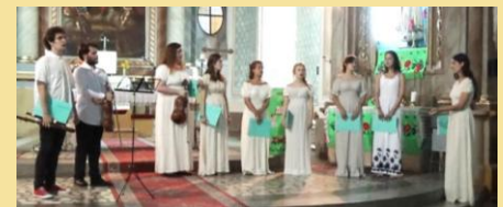
Musica Viva (Sombor, Serbia)