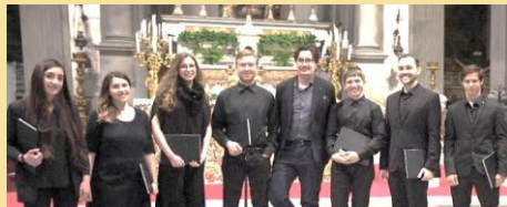
Le Temps Revient (Firenze, Italia)